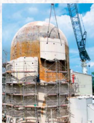
2008 wurde der Rückbau des Versuchatomkraftwerks Kahl in Großwelzheim abgeschlossen.

Seit dem Mittelalter verbindet eine Fähre das Kloster Seligenstadt mit seinen Besitzungen im Vorspessart, wo der Weinbau von besonderer Bedeutung war. Nach der Auflösung des Erzstifts Mainz und der Teilung der beiden Mainufer in einen hessischen und einen bayerischen Teil wurde die Fähre zum Grenzposten. Seit 1970 transportiert eine freifahrende Fähre Menschen und Fahrzeuge von Seligenstadt (Hessen) nach Karlstein (Bayern).