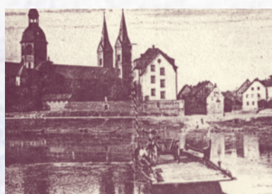
Blick auf Seligenstadt und seine Fähre vor 1920

Die Wasserburg in Klein-Welzheim wurde 1705 von dem Seligenstädter Abt Franciscus II. an der Stelle einer mittelalterlichen Befestigung erbaut. Einst war sie Mittelpunkt einer barocken Parkanlage.