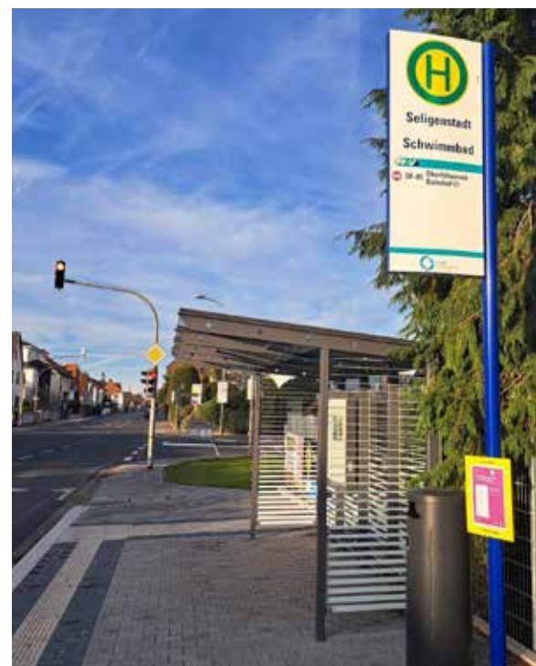
Barrierefreie Bushaltestelle am Schwimmbad