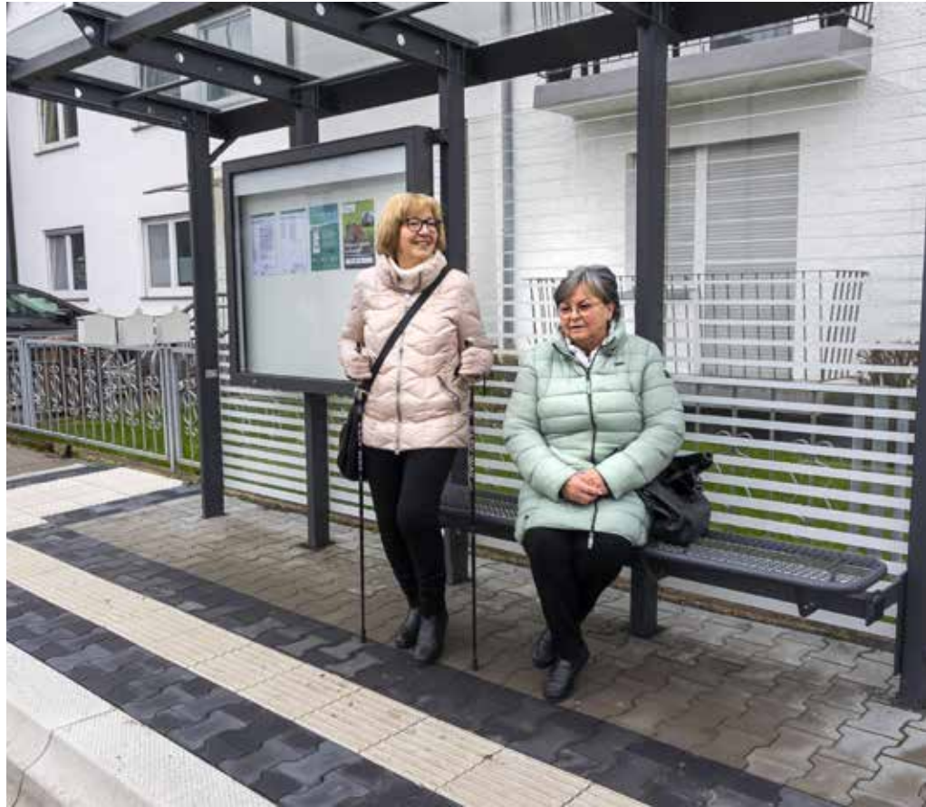
Haltestelle in Klein-Welzheim