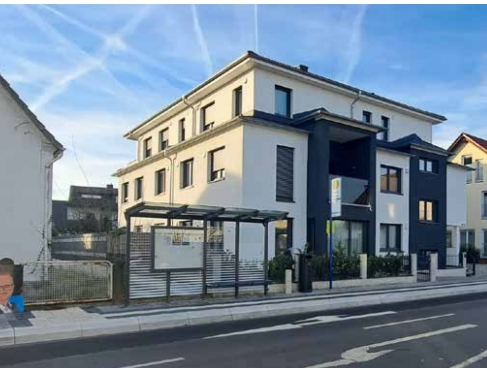
Bushaltestelle Zellhäuser Straße